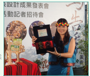
圖說：亞洲大學親善志工展示原住民馬告醬汁。

記者會後，與會人士品嚐原住民搭配「馬告」的美食，如冰淇淋、蛋糕、香腸、咖啡、茶葉等，現場還擺設南投縣山地部落的手工製的原住民飾品，如首飾、皮包、衣服、生活用品等，提供與會人士購買。