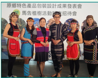
圖說：亞洲大學親善志工，身穿原住民服飾參加原鄉商品成果暨馬告植樹活動記者會。

南投縣政府舉辦原鄉商品成果暨馬告植樹活動記者會，邀請亞洲大學親善志工，身穿原住民服飾展示服務，表現可圈可點。