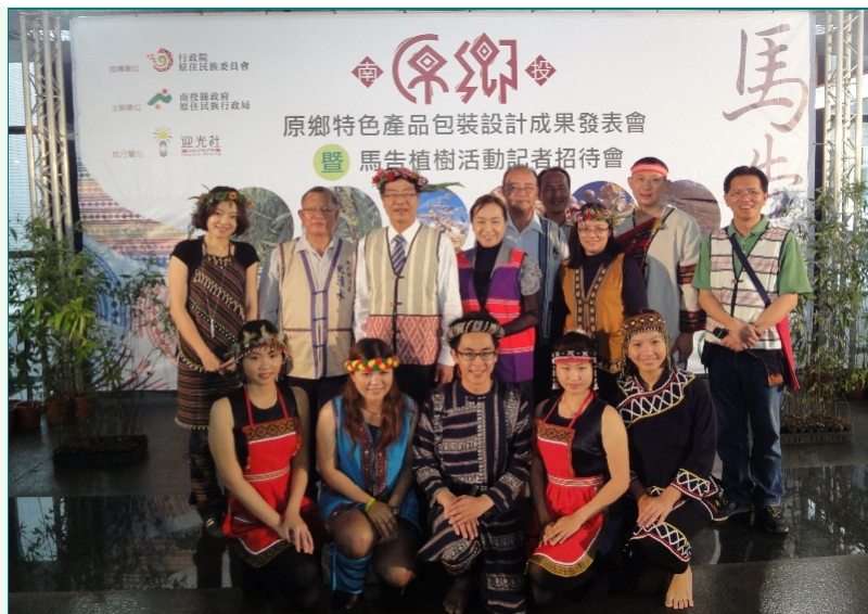
圖說：亞洲大學親善志工參加原鄉商品成果暨馬告植樹活動記者會，與南投縣長李朝卿(後排左三)等與會人員一起合照。