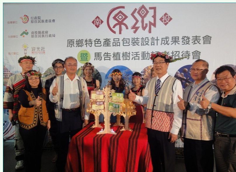
圖說：亞洲大學親善志工參加原鄉商品成果暨馬告植樹活動記者會，與南投縣長李朝卿(右三)等與會人員一起合照。

李朝卿縣長稱讚亞大親善志工的表現，可圈可點，他還向亞大親善志工說，這學期，他已經受聘到亞大任教，成為亞大兼任教師，也是亞大的一份子。